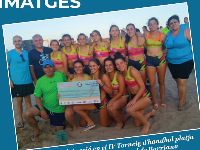
Èxit de participació en el IV Torneig d'handbol platja celebrat a la platja de l'Arenal de Borriana