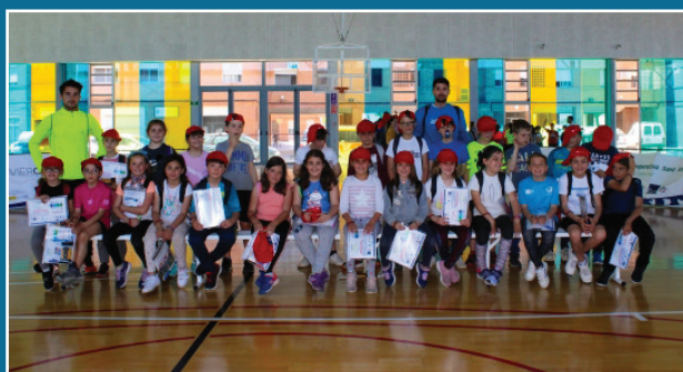
El SME clausura les Jornades Multiesportives de Pasqua amb la participació de 130 xiquets i xiquetes de Borriana