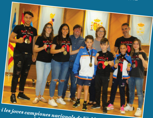
Els i les joves campiones nacionals de Kickboxing del Club Kaizen visiten l'Ajuntament de Borriana