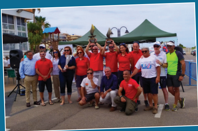
La Jubilat's Cup torna a reunir a Borriana a centenars d'aficionats a la vela