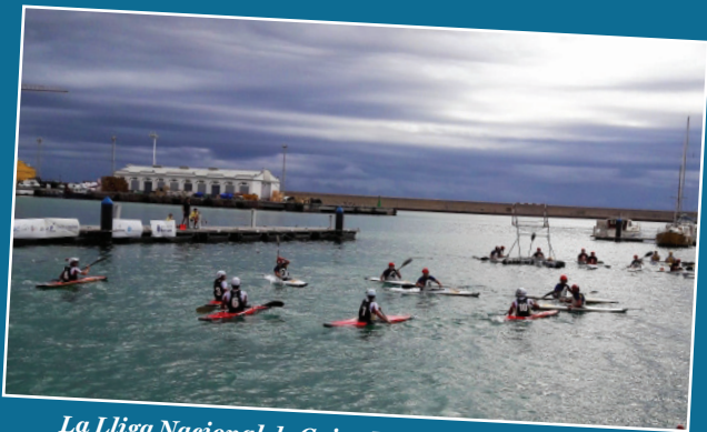
La Lliga Nacional de Caiac Polo torna a Borriana amb la Categoria Absoluta tant femenina com masculina