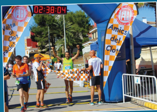
El Clot torna a vestir-se del millor atletisme amb els 60 equips participants en la VII edició de la Maraclot