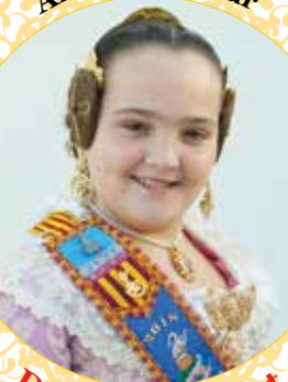
Dama de la Ciutat