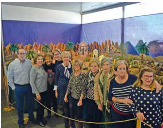
Betlems a Borriana

Així, amb la visita del Pare Noel, el castell inflable, la màgia, l'es-