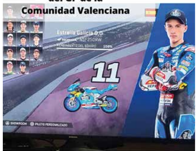
Sergio Garcia Dols campió en el circuit Ricardo Tormo de Xest en el Gran Premi Motul de la Comunitat Valenciana en Moto3.