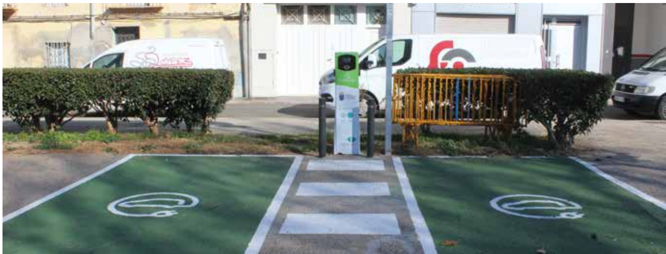
Obras pto recarga vehículos eléctricos

Amb un cost de 14.525 euros, la iniciativa està subvencionada al 80 per cent per l'Institut Valencià de Competitivitat Empresarial (IVACE)