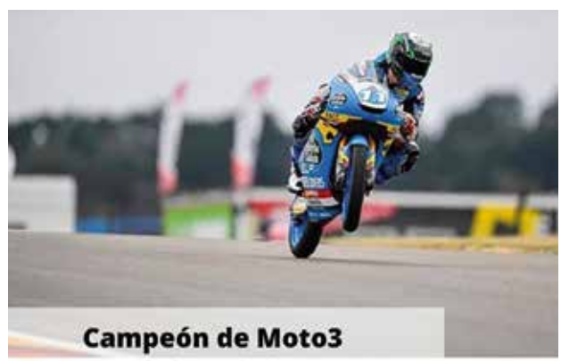
Campeón de Moto3 del GP de la