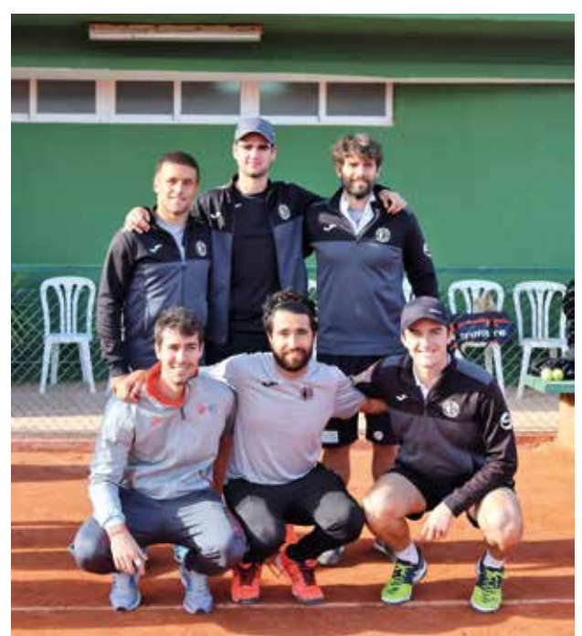
El Club de Tennis Borriana lluita en el Torneig Absolut de tenis de la Comunitat Valenciana i aconsegueix evitar el descens.