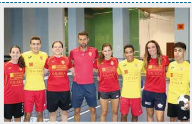
L'equip Futnet Borriana participa en el Mundial femení i Sub 21 masculí de Futnet a Eslovàquia.