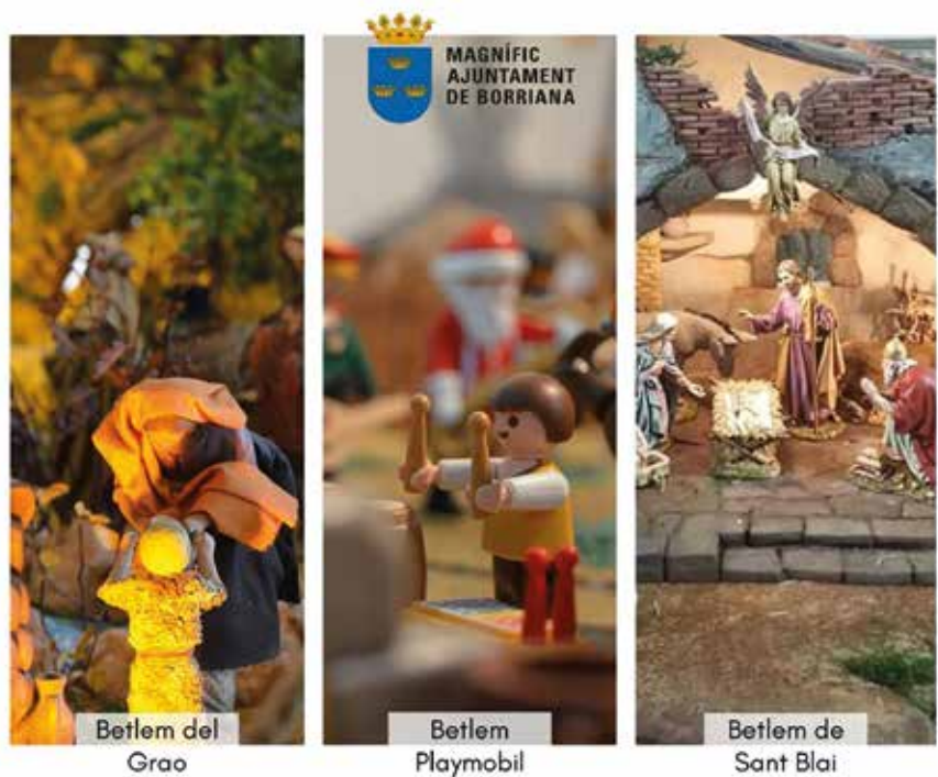
Betlems a Borriana

A més a més, a Borriana hi ha hagut una important oferta de Naixements, com ara, el betlem de Playmobil en el