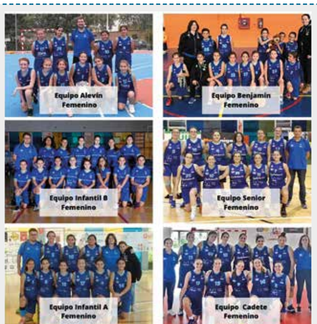
El CB Borriana demostra l'alt nivell de les seues jugadores en tots els equips femenins en les diferents categories en els campionats de bàsquet.