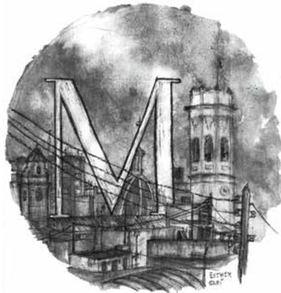
(il·lustració: Esther Garí)

MÉS MUDAT QUE GERINELDO. Gerineldo és el patge protagonista del Romanç de Gerineldo i la infanta , un exponent de la poesia medieval popular