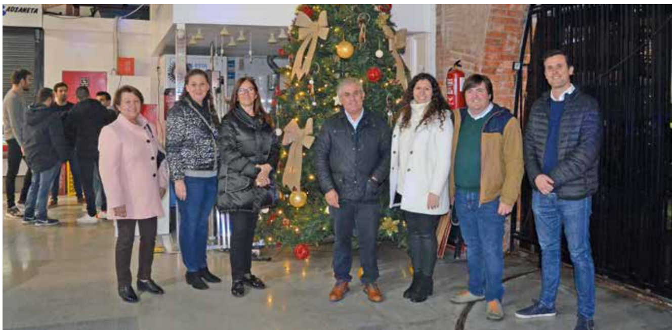
La Nit del Mercat.

amb el seu recorregut per la música pop-rock espanyola dels 80 i els 90. Un esdeveniment molt positiu per donar a conèixer totes les parades que formen part del mercat municipal. Una nit diferent en què es pot conjugar la venda de productes de qualitat del mercat amb la diversió, la música i el Nadal. ♦