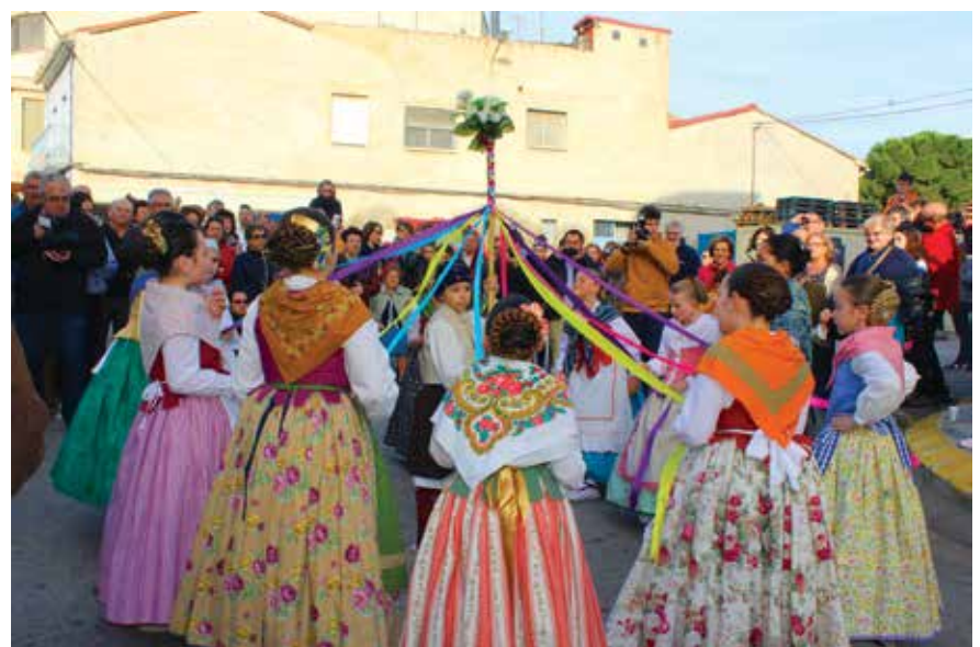
Grup Infantil de Danses Tradicionals del CM Rafael Martí de Viciàna

Un total de 881 dones boixeteres han mostrat el seu treball el diumenge previ al dia del patró a la Llar Fallera de Borriana en la vint-i-tresena edició de la Trobada de Boixeteres de la ciutat, que s'ha convertit ja en tot un referent en aquest tipus de reunions,