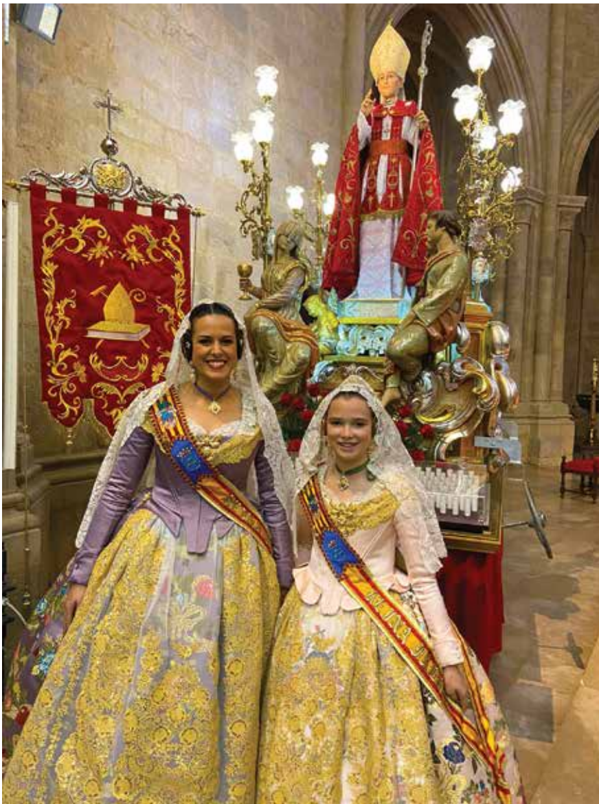
Les Reines falleres en missa Major a la basílica del Salvador el dia de Sant Blai

en què la tradició, l'art i les dones en són protagonistes.