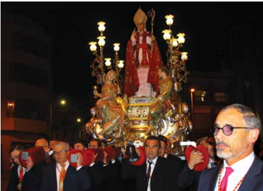
Processó de Sant Blai

També es va distribuir suc de taronja natural, i una degustació de taronges flamejades, cortesia de l'Associació d'Hostaleria de Borriana, mentre el grup infantil de Danses Tradicionals del Centre Municipal de les Arts Rafael Martí de Viciàna, va realitzar una mostra del folklore local i autòcton.