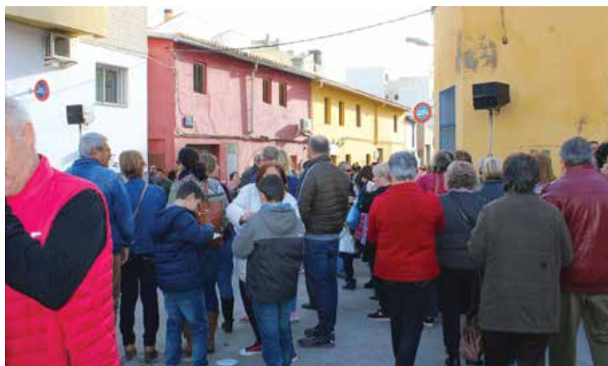
Filera de persones a la Font del Vi

La filera de persones fent cua va créixer, a poc a poc, i milers de veïns i veïnes van desfilar per a beure fins a 200 litres de vi de la font, i per arreplegar de mans de les representants falleres, els entrepens preparats a base de llonganissa i botifarra que van superar les 2.500 unitats al llarg de l'hora i mitja de repartiment.