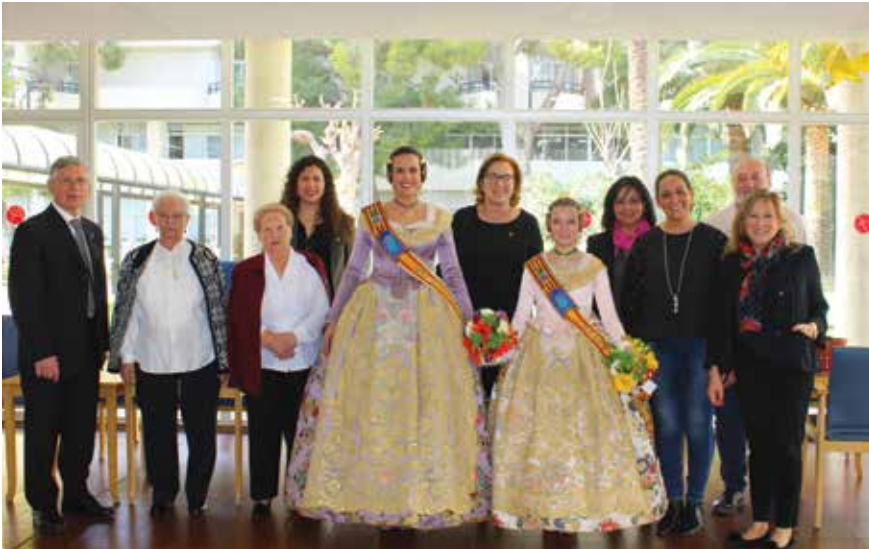
Visita a la residència de persones majors dependents de la Generalitat Valenciana