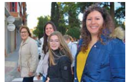
Volta a les Ermites 2020

Ja des de l'inici i després d'un complet desdijuni amb xocolata i fartons, centenars de persones van poder gaudir de la ruta amb un total de 25 quilòmetres de trajecte entre camins de tarongers i la mar, que permet recórrer el patrimoni cultural de Borriana i el seu entorn natural, en un circuit que agrupa les 6 ermites disperses en el terme municipal: Sant Blai, Santa Bàrbara, Sant Gregori, la Mare de Déu de la Misericòrdia, l'Ecce Homo i la Sagrada Família a les alqueries del Ferrer.