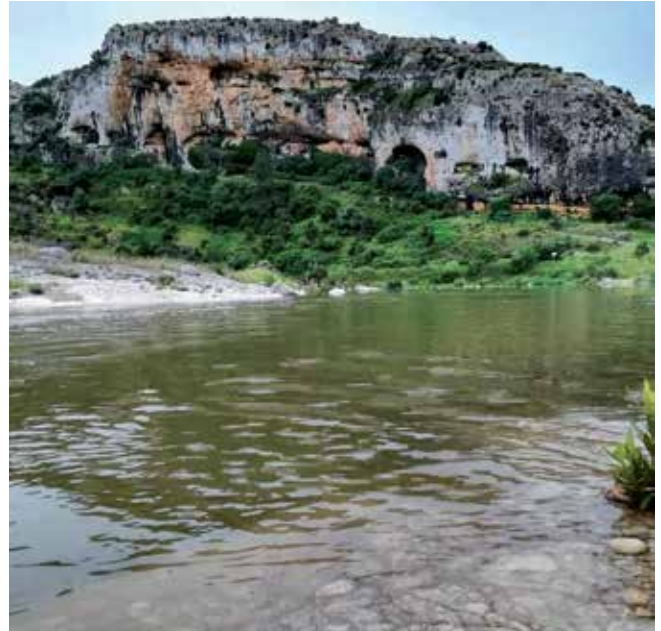
La Moreria, rambla de Sant Mateu (riu Sant Miquel) (les Coves de Vinromà)

TOT ÉS VERITAT, Es tracta d'una expressió que diem sovint a ma casa, a propòsit d'una anècdota d'arrels borrianenques que contava ma mare. Eren els anys de postguerra (1947) i Borriana, encara amb els carrers enfangats i per empedrar, sense cap tele que la distraiguera de la murga de Ràdio Nacional d'Espanya, es va sentir commocionada per l'anunci de l'aparició de la Mare de Déu a la localitat de les Coves de Vinromà. Més enllà de qualsevol explicació racional, una xiqueta de la zona, segurament influenciada per la pel·lícula La canción de Bernardette sobre les aparicions marianes a Lourdes, va profetitzar que el dia 1 de desembre a les 15h s'eclipsaria el sol i el dia esdevindria nit. El fred i la pluja no van dissuadir la gent dels pobles de la contornada d'organitzar caravanes de pelegrinatge, així que que proveïts de carro i manta, en bicicleta, a peu