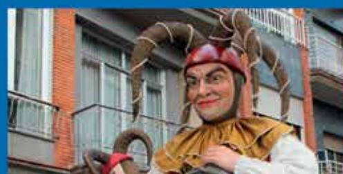
Geganter d'honor Nomenament 2021

Teatre Payà 5 febrer | Preu 45€ platea, 40€ amfiteatre | 21.30h