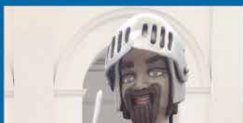
14é Aplec de Gegants i Cabuts Exposicions

Auditori Juan Varea 24 gener, 19h | Gratuït