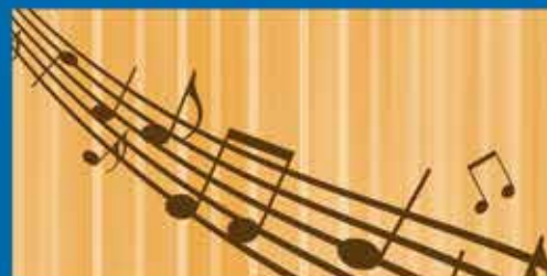
Da cap quintet Concert

Auditori Juan Varea 24 gener, 19h | Gratuït