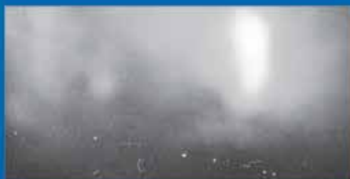
De memòria Alumnes UPV Exposició