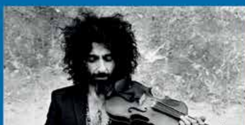
Ara Malikian Le Petit Garage

Teatre Payà 5 febrer | Preu 45€ platea, 40€ amfiteatre | 21.30h