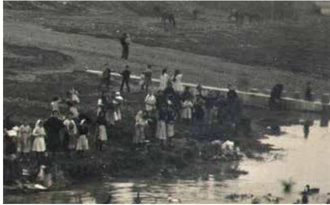
Setena entrega (ve de EL PLA núm. 477)

A CAGAR A LA VIA! Forma de tancar una disputa amb contundència; és com dir "ja n'hi ha prou". Amb el mateix sentit vegeu també "a cagar al riu". Als nostres pobles, tant el riu com les vies del ferrocarril són moltes vegades zones apartades d'extraradi.