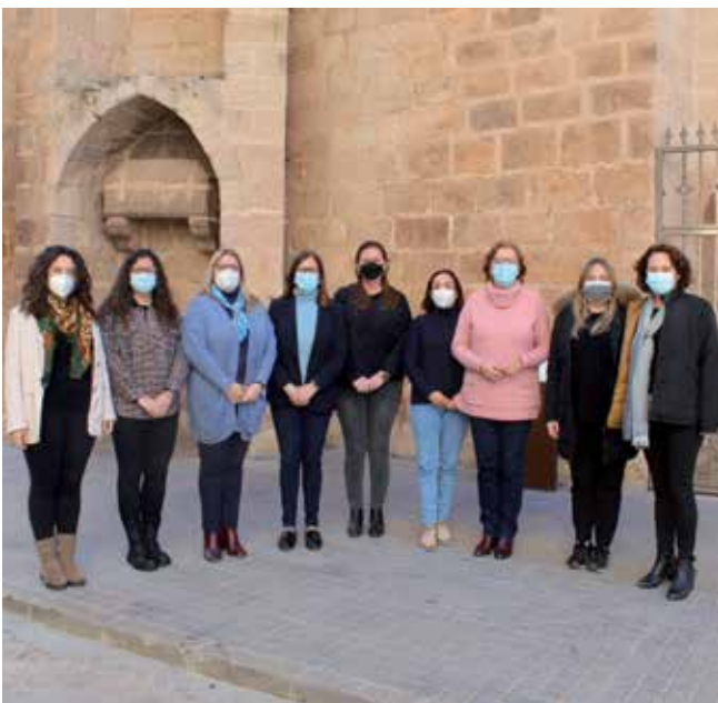
Regidores que formen part de l'actual corporació municipal