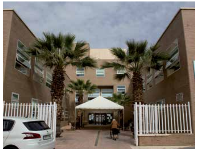
Nou Centre de Salut en Carretera Nules de la Generalitat Valenciana