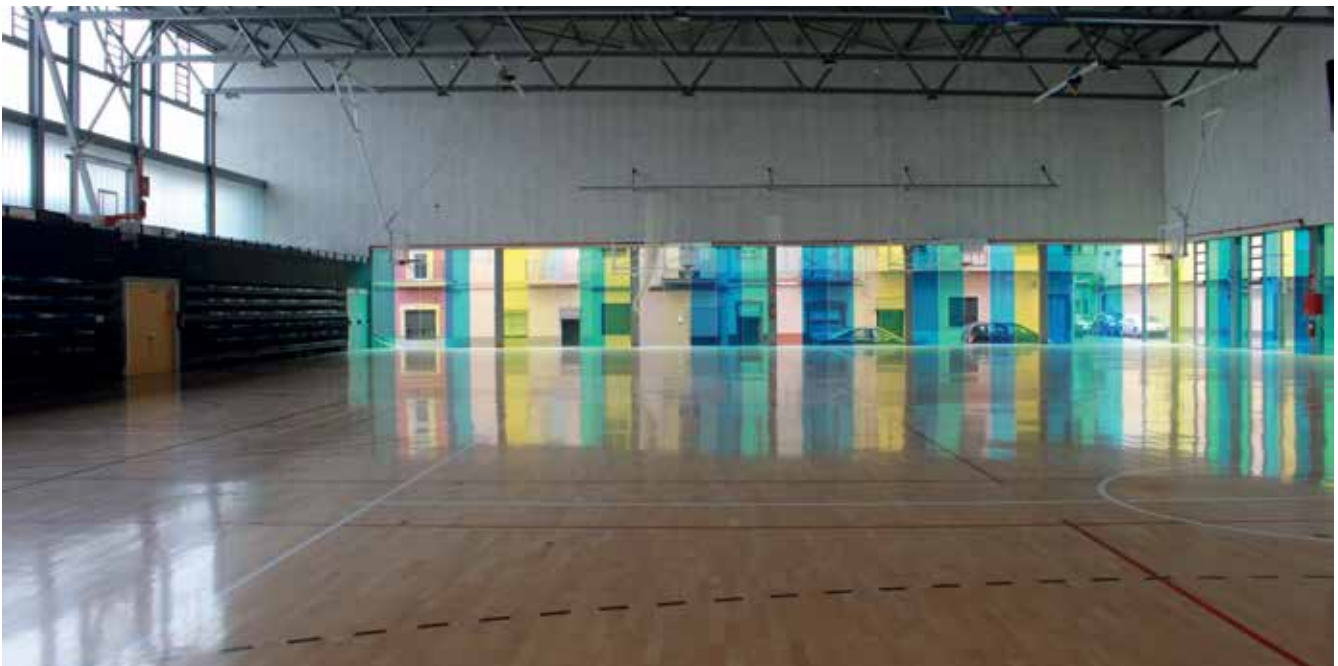
Remodelació del Pavelló la Bosca amb fons de l'Estat del Pla Zapatero.