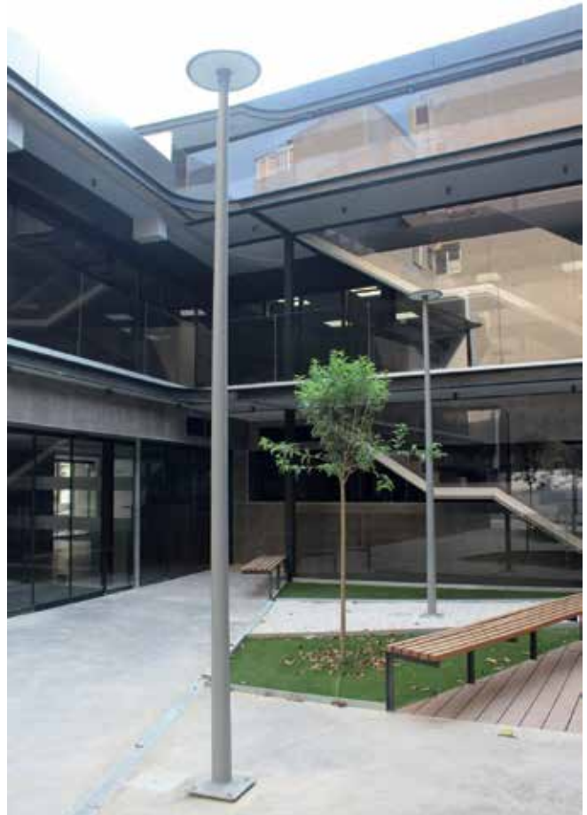
Nou edifici de Serveis Socials (Ajuntament/Pla Edusi)