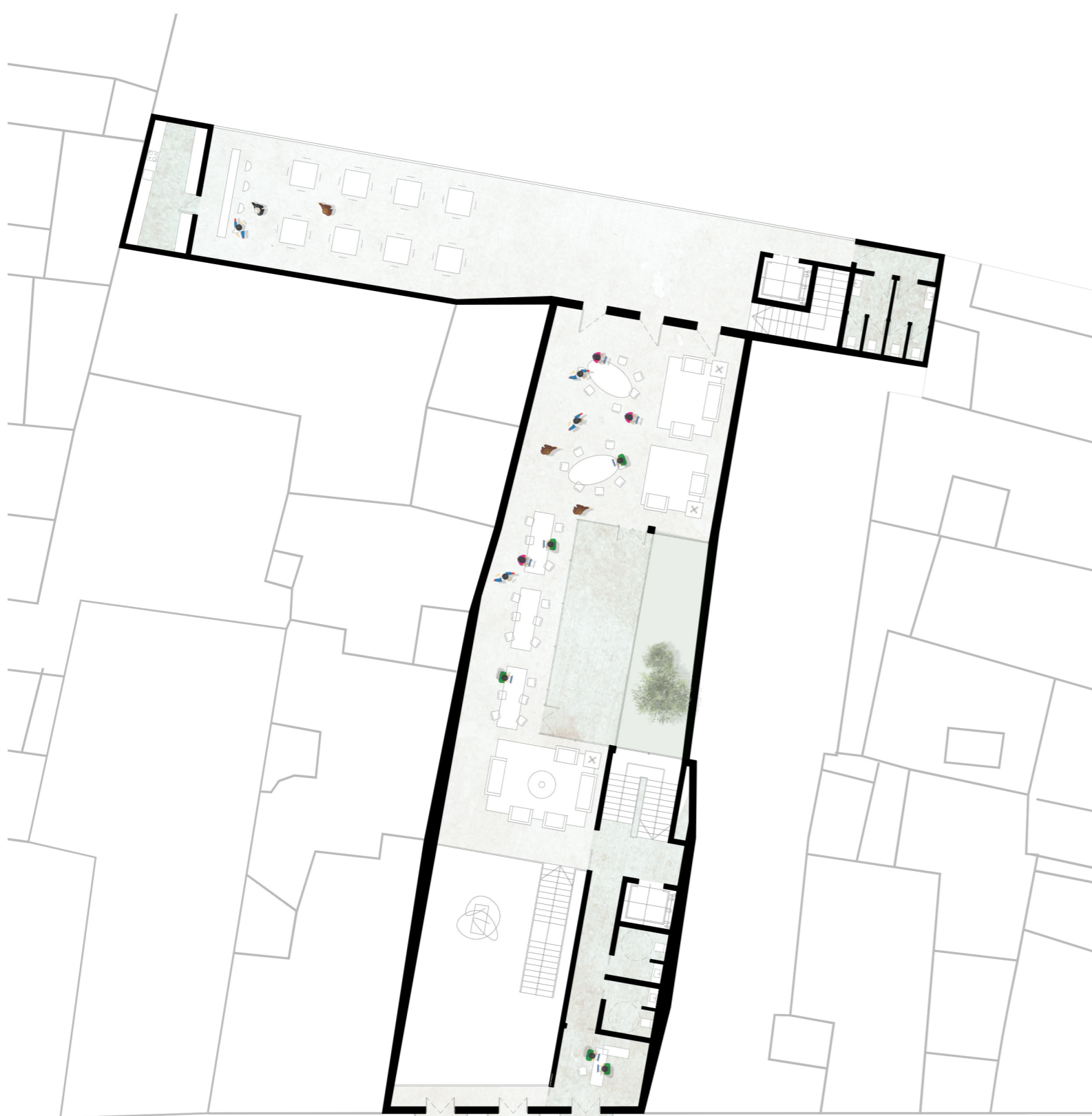
Planta primera + 4.40m Escala: 1/250

Mi objetivo con la intervención es simple: todo ciudadano debe sumar para crear una ciudad mejor , para ello, debemos integrarlos en todo el proceso, haciéndolos partícipes de la propuesta, ya que al final seremos todos los que la disfrutaremos.