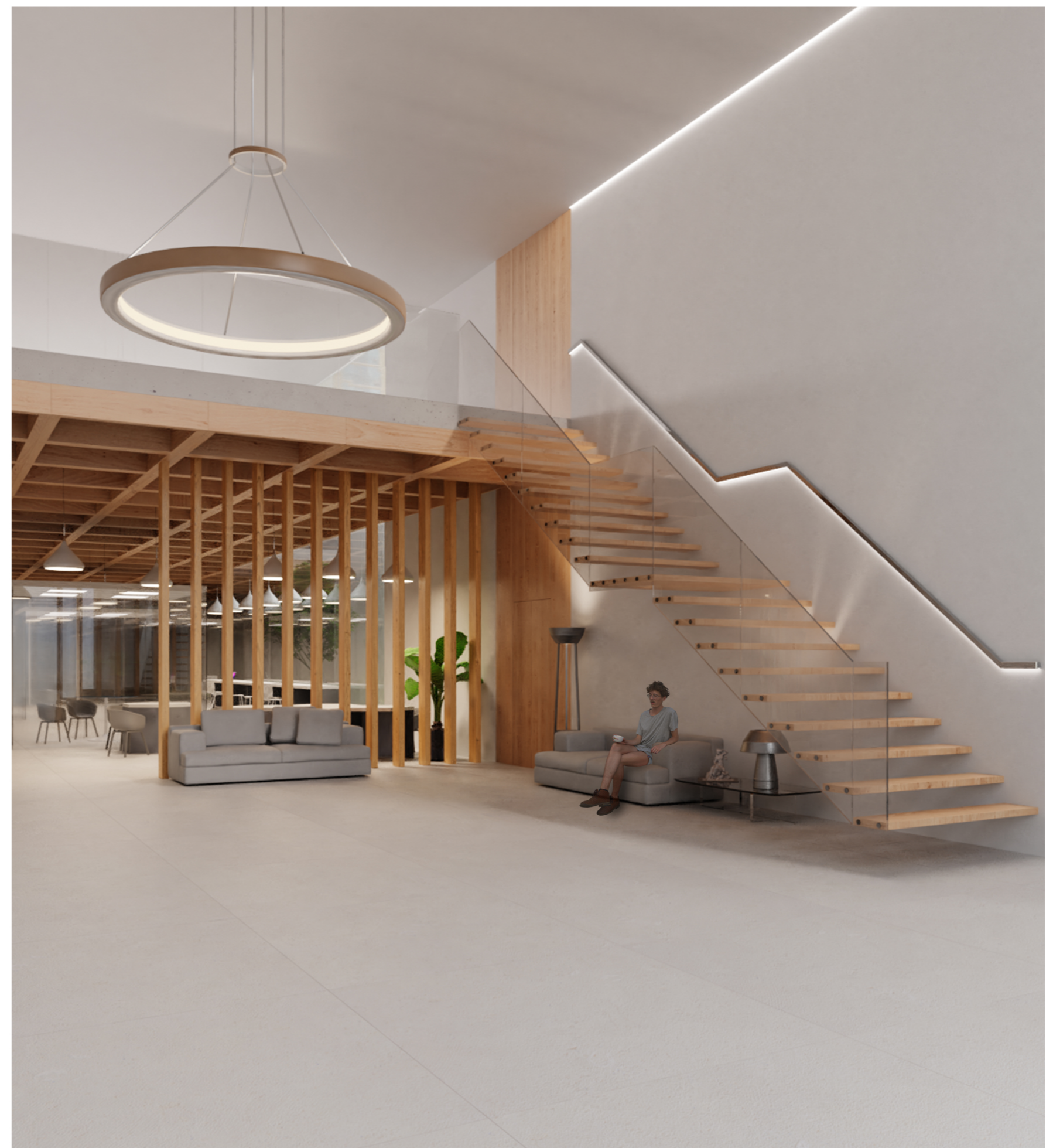
Detalle acceso vivero de empresas por la calle El Raval.