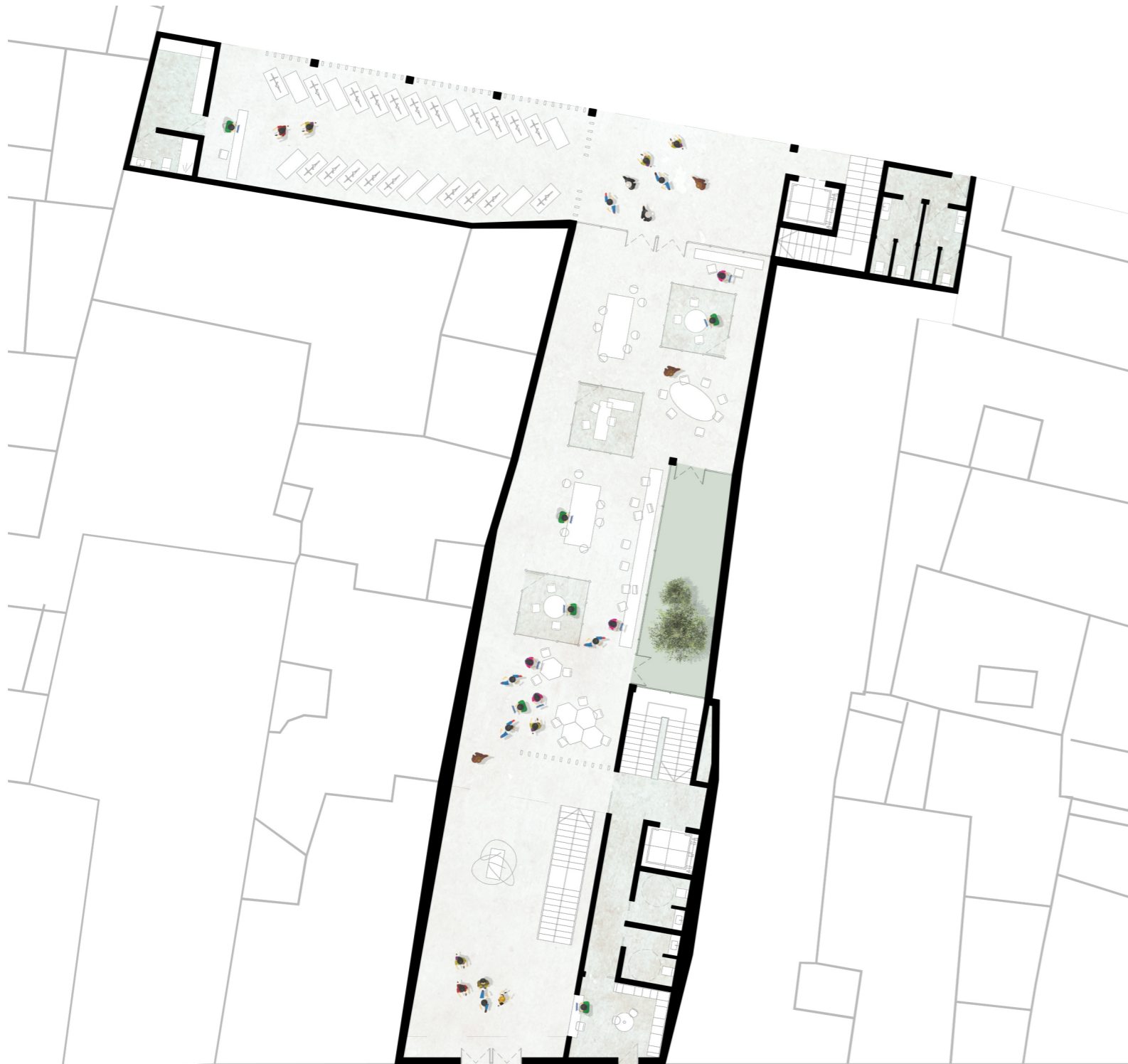
Planta baja + 0.00m Escala: 1/250