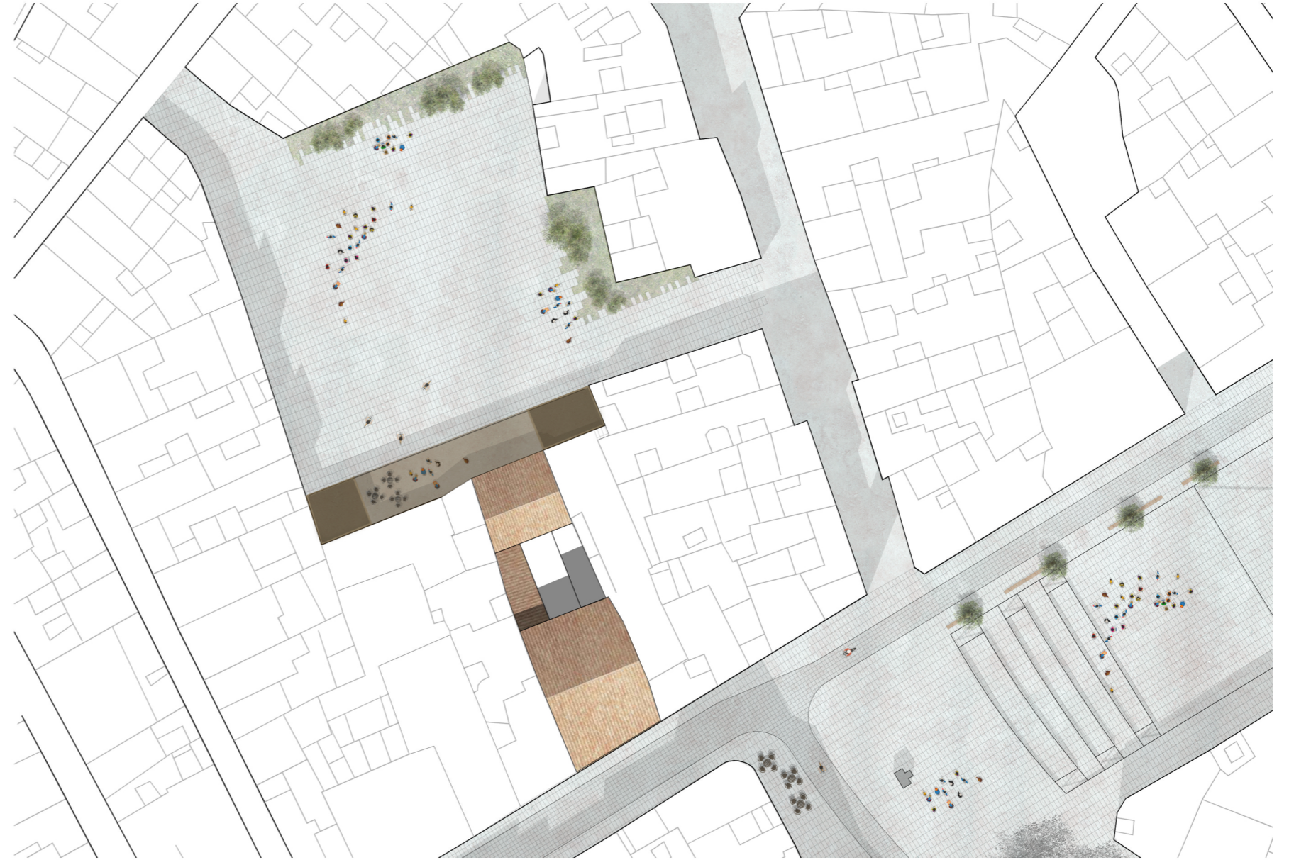
Planta cubierta + Terraza Payá · Escala: 1/750

Mi objetivo con la intervención es simple: todo ciudadano debe sumar para crear una ciudad mejor , para ello, debemos integrarlos en todo el proceso, haciéndolos partícipes de la propuesta, ya que al final seremos todos los que la disfrutaremos.