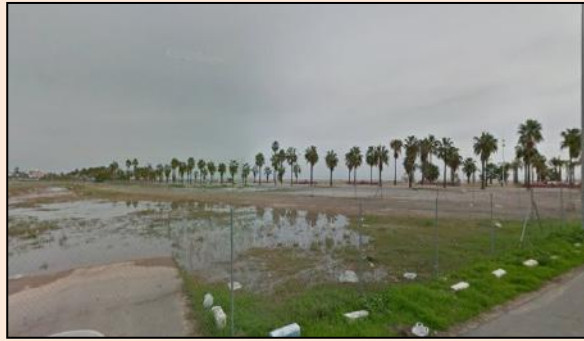
Situación actual de la parcela objeto de actuación

La actuación se llevará a cabo en un espacio actualmente degradado y sin uso, pero con un enorme potencial, debido a su situación estratégica, junto a la playa del Arenal. Por una parte se plantea el diseño y desarrollo de un parque-espacio natural con plantaciones de especies autóctonas y con una zona de reserva para favorecer la formación de dunas, ocupando una superficie de 28.829 m 2 .