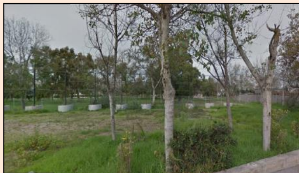
Situación actual del bosquete

En conjunto se quiere crear un parque formado principalmente por un bosque de ribera frente al mar, dividiendo el recinto a replantar en tres franjas con distintas especies botánicas. De hecho, en la arena, y hasta el paseo marítimo, ya existe una parcela de reserva de vegetación. Justo después del paseo, en la zona de servidumbre, se plantarán árboles autóctonos, como el pino blanco o el tamaje (tamarix gallica); especies mediterráneas no invasoras y ejemplares aptos para sobrevivir a las condiciones del terreno y la salinidad del mismo. A su vez, se instalará mobiliario urbano (papeleras, bancos, farolas, etc.) integrado en el ambiente, intentado minimizar el impacto visual.