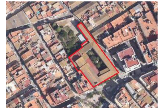
Planta catastral y Esquema de ocupación de parcela