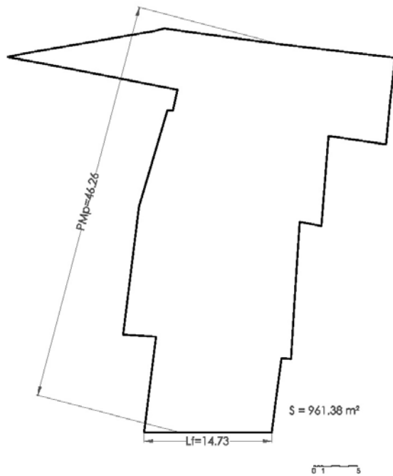
ESQUEMA EN PLANTA