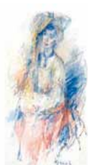
Forner CMC La Mercè - Borriana Inauguració dia 9 de maig, 19.00 h. Del 9 de maig al 15 de juny. www.borrianacultura.es

Inauguració de l'exposició "Forner". Fins al 15 de juny 9 de maig, dijous, 19 h. CMC La Mercè.