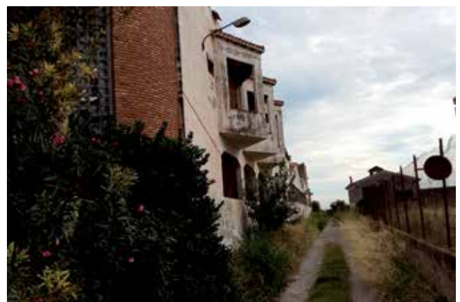
Peu de foto: Enderrocament de la paperera del camí d'Onda