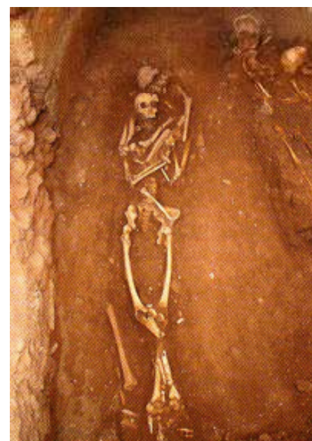
Figura 5: Inhumación moderna en Racó de la Abadía (Melchor, 2009).

Nº de listado: 1, 2, 3, 4, 5, 6, 7, 8, 9, 10, 11, 12, 13, 14, 15, 16, 17, 18, 19, 20.