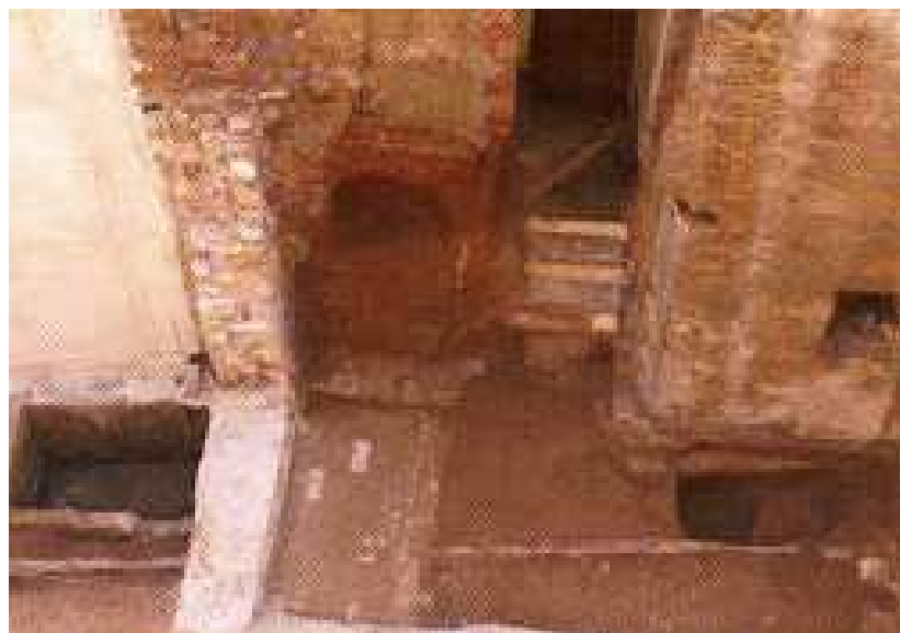
Figura 4: Restos de muralla y una torre en Racó de la Abadía (Melchor, 2009).