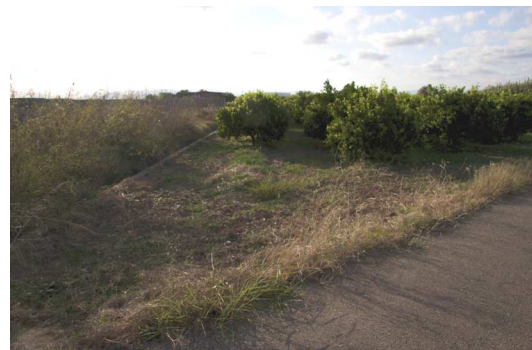
Figura 3: Vista actual del área de El Tirao.