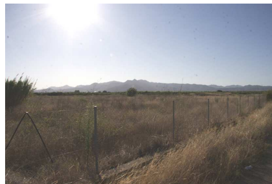
Figura 2: Vista actual del área de Llombai.