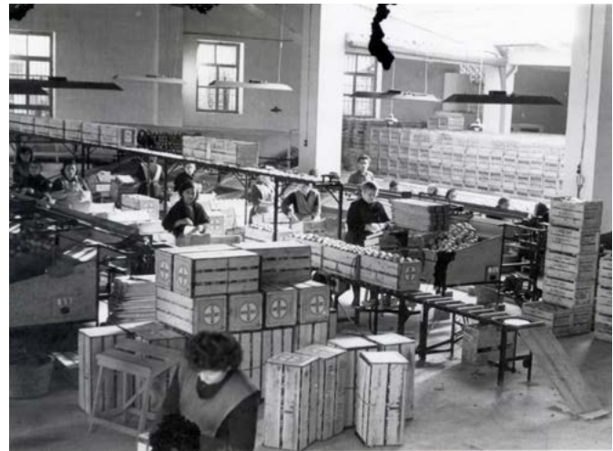
Confeccionadores de taronja en la temporada 1954-1955.