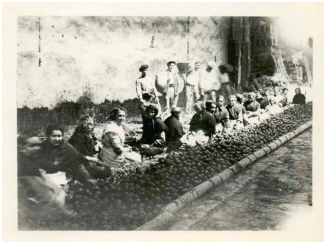
Confeccionadores de taronja. Arxiu del Museu de la Taronja, C-0042.

La intenció, per tant, ha sigut evidenciar totes aquestes circumstàncies, posant de manifest la realitat de les condicions laborals, l'agitació social i l'activitat sindical de les dones que contrasta enormement amb aquelles joves passives i alegres que ens presenta l'imaginari col·lectiu de la taronja. Si bé és cert que l'activitat tarongera significà un gran creixement econòmic i demogràfic per a la capital de la Plana, el benefici no aplegà a totes les butxaques, i la producció i comercialització citrícola va recolzar sobre la força de treball de milers d'obrers per a enriquir una determinada elit econòmica. Entre els obrers, les confeccionadores es trobaven en una posició especialment injusta, ja que rebien una quantitat notablement inferior que els homes pel seu treball.