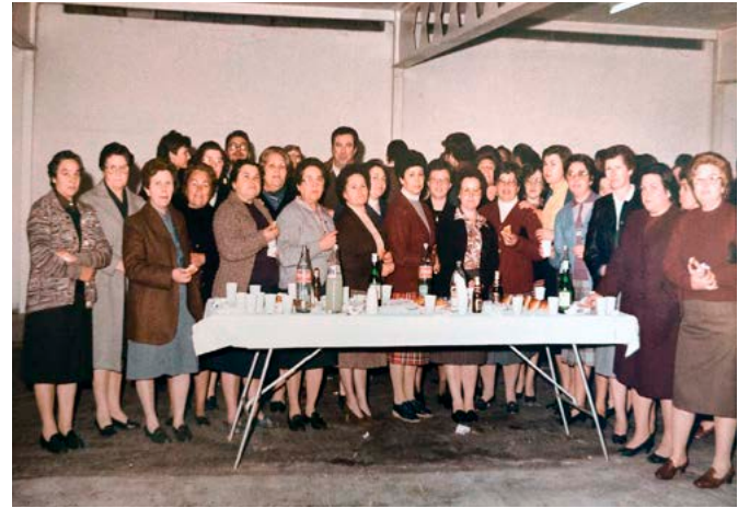
Confeccionadores de taronja durant la segona meitat del segle XX.

En definitiva, hem intentat presentar una nova mirada sobre el passat taronger de Borriana, defugint els relats tradicionals, amb una proposta que tracta de posar en valor el paper de les treballadores dels magatzems de taronja, que encara hui en dia es compten per milers i són una part imprescindible de l'estructura econòmica de la Plana, i de Borriana en particular. Hem tingut la pretensió de recuperar una part fonamental i oblidada (o eludida) de la història borriana. Així doncs, un objectiu derivat ha sigut el d'oferir una mena d'homenatge a tots aquells obrers que han treballat i encara treballen en la taronja, però especialment a les confeccionadores, que han patit una doble invisibilització.