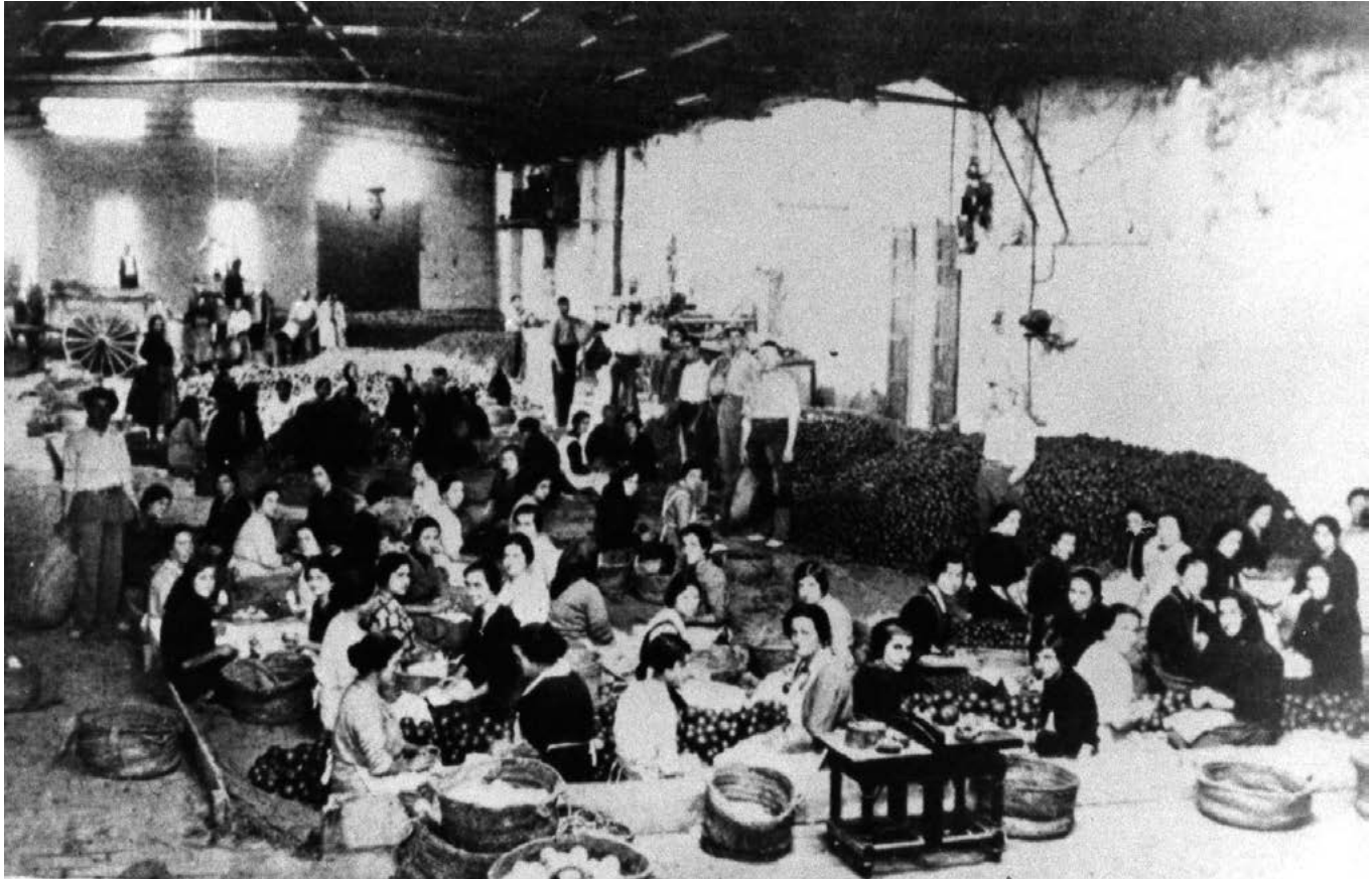
Dones al magatzem.

normalment d'octubre a maig, amb una especial intensitat en el període entre desembre i febrer. D'aquesta manera, la dona podia col·laborar en l'economia familiar durant la temporada, i la resta del temps, ocupar-se de la família i la llar. 104