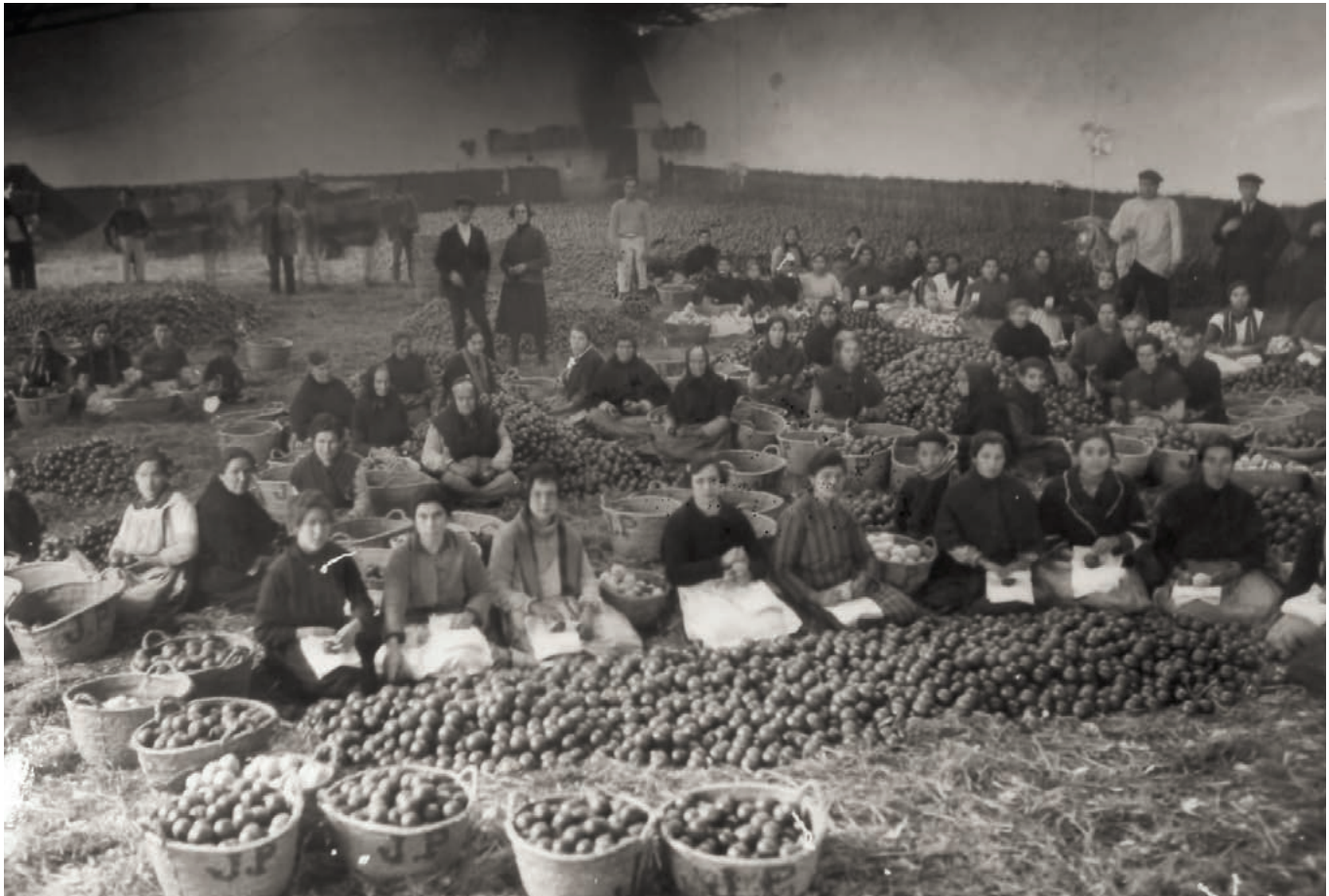
Vista general magatzem de taronja. Arxiu del Museu de la Taronja, C-0003.

o tingueren algun desperfecte considerable com per a ser descartades. Una volta els tres cabassos estaven plens, els traslladaven alguns homes designats per a aquesta feina a un lloc on formaven dos muntons, un per a les taronges bastes i l'altre per a les fines. Al voltant d'aquests muntons se situaven, formant un cercle i seient sobre palla o sobre el mateix sòl del magatzem, altres treballadores per parelles, amb cinc cabassos. Allí les classificaven: un per a la taronja de primera, un altre per a les floretes, un altre per a les segones, un altre per a les terceres i un altre per a les descartades. Aquestes classificacions es corresponien a distintes grandàries que amidaven amb una mà i els dits de l'altra que es necessitaven per a unir el dit del mig i el gros. 94