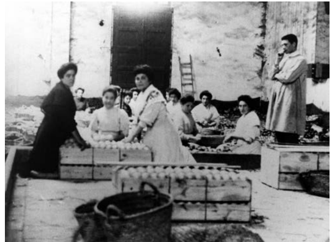
Encaixadores. Arxiu Municipal de Borriana. Col·lecció Museu Arqueològic.

En 1920 es posà en marxa un projecte per a elaborar un contracte col·lectiu de treball a la Plana, pel que respectava a l'explotació tarongera. Es realitzà un congrés agrari a Castelló i s'hi reuniren representants del govern, dels sindicats i de la patronal, per tal de negociar distints aspectes relatius a les condicions de treball. Pel que fa als salaris, es tractà de fixar uns mínims que havien de ser garantits en cada poble i s'aplegà a un acord. El salari per als collidors es fixava en 4 pessetes diàries, mentre que en el cas de les collidores es reduïa a 2. Als magatzems, les dones haurien de cobrar entre 2 pessetes i 2,50. Per contra, la resta del personal de magatzem, com els qui transportaven el cabàs, cobrarien entre 4,50 i 5 pessetes, i els embaladors de 5 a 6 pessetes. 97