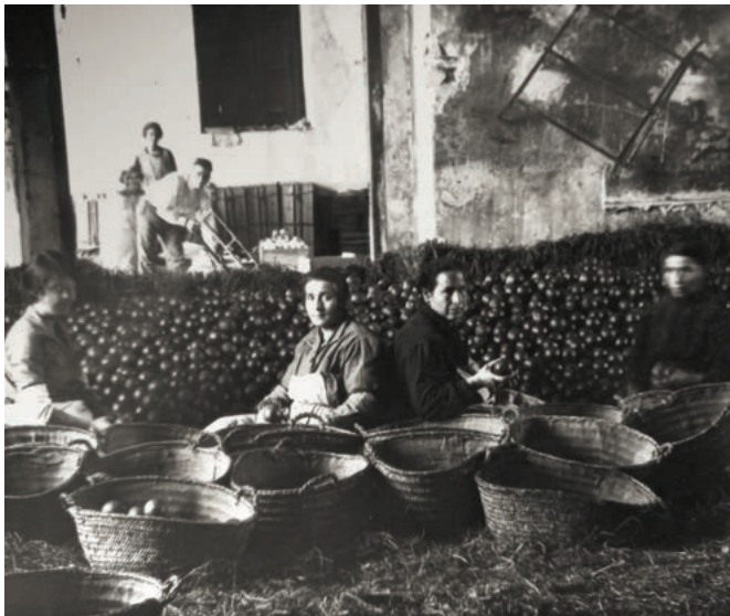
Dones treballant al magatzem. Arxiu del Museu de la Taronja, C-0004.

En un treball recent, que estudiava les condicions de les treballadores en les últimes dècades del segle XX i dels anys 2000, Paloma Candela Soto enumerava algunes de les característiques del treball femení als magatzems. Algunes de les qüestions que ressaltava eren la temporalitat del treball, l'obligatòria flexibilitat horària, la docilitat o l'escassa qualificació que demana el sector, en definitiva, un perfil molt concret, que ja tenien les mares i les àvies de les seues entrevistades. El treball és fix discontinu, és a dir, els magatzems compten amb les treballadores totes les temporades, però l'ocupació només dura uns mesos. I requereix, a més, una gran flexibilitat horària, i és que, moltes voltes, són avisades només amb un dia o unes hores d'antelació quan han de treballar i en moments puntuals de la temporada és necessària la realització de moltes hores extres. 99