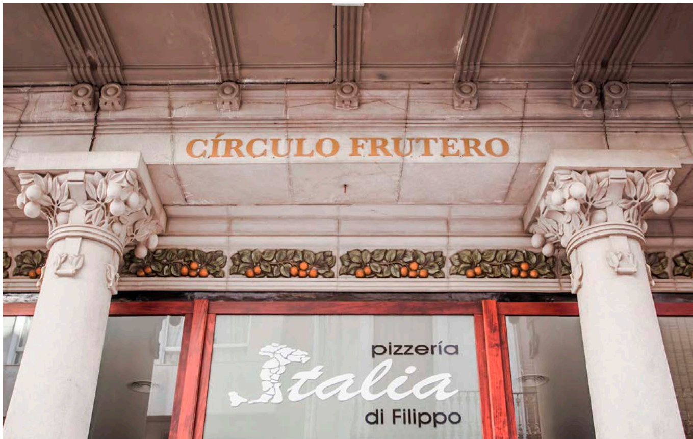
Círculo Frutero, Ajuntament de Borriana: https://turisme.burriana.es/

Roca i Alcaide explicà alguns d'aquests canvis, per exemple, el fet que la grandària de les cases es reduí en passar al monocultiu, atés que ja no necessitaven emmagatzemar les collites a casa, i, en reduir-se'n la grandària, els propietaris pogueren centrar-se a embellir-les i ornamentar-les, convertint-les en " tacitas de plata ". 76 Precisament a partir de la segona meitat del XIX, amb l'auge comercial de la taronja, començà a introduir-se el modernisme tan característic del centre urbà borriànc. Encara que Roca i Alcaide parlava generalitzadament de tota la població, Benito Goerlich explica que l'auge de la introducció dels nous estils arquitectònics tingué lloc el 1930, i que foren part dels més de dos-cents comerciants de taronja que hi havia els qui realitzaren canvis a les seues cases per a reflectir el seu estatus social, sempre mirant cap a València com a referent. 77 Alguns exemples paradigmàtics podrien ser l'edifici del Círculo Frutero, amb nombrosos motius cítrics en la seua decoració, o el mercat modernista, que també reproduceix en la seua decoració molts elements relacionats amb la taronja.