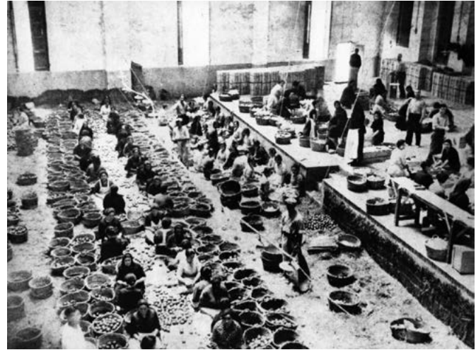
Vista general magatzem.

Una altra de les qüestions que s'atengué fou la climatització. En l'època en què es redacta l'informe, l'autor parla de la calefacció com una innovació que encara no s'ha estés en la major part de magatzems, i destaca que els obrers es queixaven del fred, i els patrons ho reconeixien. Inclús parla d'alguns magatzems on la fruita va aplegar a congelar-se, i considera com de difícil degué ser treballar en aquelles condicions. Ens podem fer una idea, per a la nostra cronologia, en què les condicions no serien molt distintes. 106 Parla també dels serveis sanitaris i l'aigua potable, un dels aspectes, en la seua opinió, menys cuidats dels magatzems de taronja. Enumera, a continuació, alguns exemples de magatzems visitats, i convé que la majoria d'aquests no compten amb vestidors correctament habilitats, ni solen tindre dutxes ni fonts d'aigua adequades. En cas d'haver-n'hi, solen estar en mal estat i hi ha quantitats mínimes per a un gran nombre de treballadores. 107 En definitiva, els magatzems de taronja estaven lluny de ser un lloc de treball adequat que complira els estàndards i exigències que considerem necessaris hui en dia. Més aviat, eren llocs mal aclimatats amb instal·lacions poc confortables per a les treballadores.