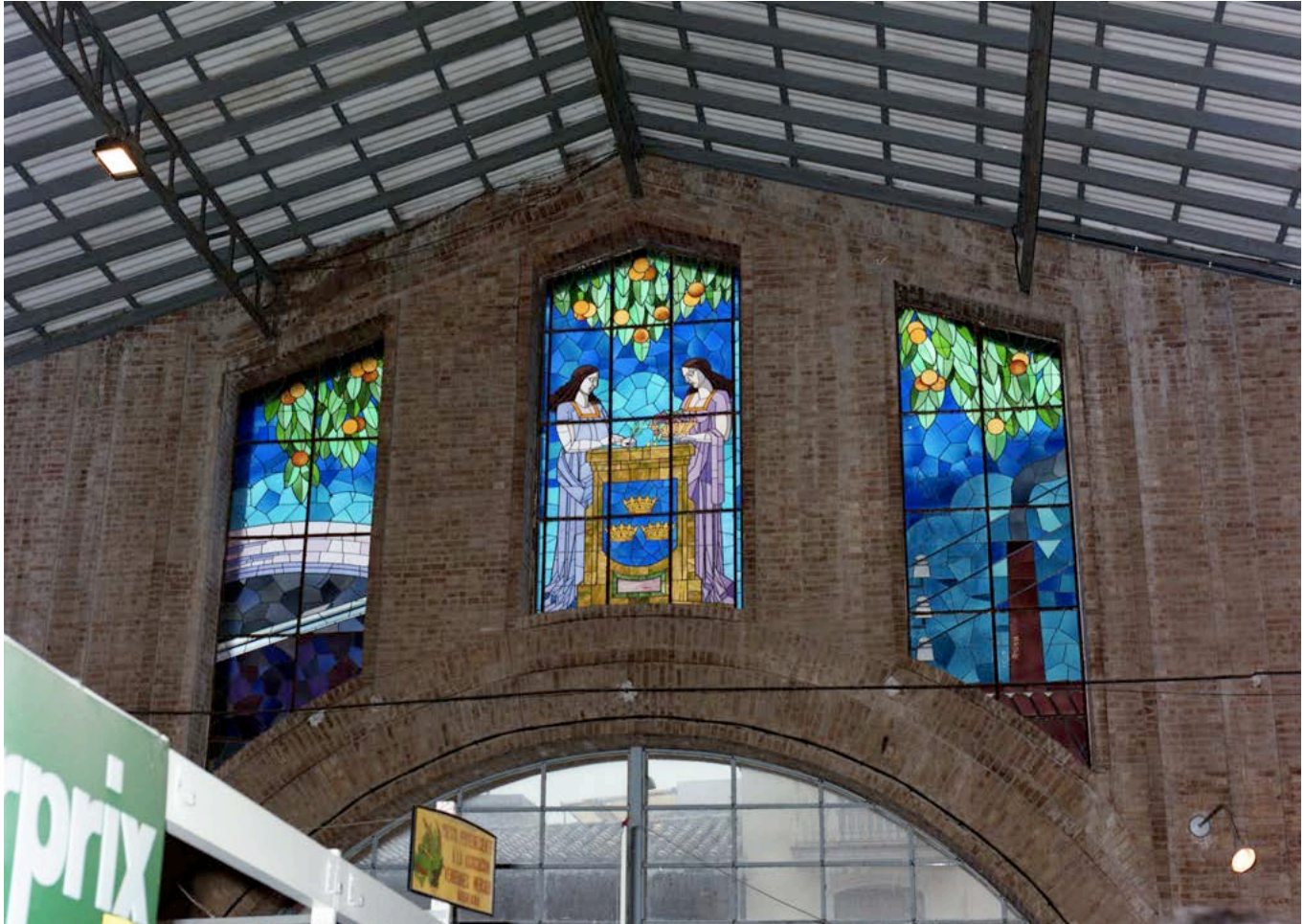
Detall del Mercat Municipal.

parte", esto es, dos millones". 74 Carles Sarthou, pel que respecta a Borriana, escrigué: "Cuanto hemos dicho sobre el particular en el capítulo tercero de la parte general de este libro, puede aplicarse a Burriana, pues nadie se atreverá a discutirle la supremacía en el emporio del dorado fruto". 75