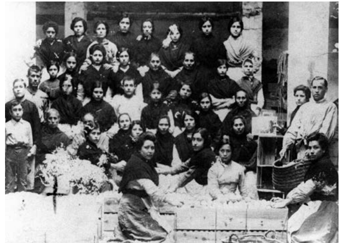
Confeccionadores de taronja.