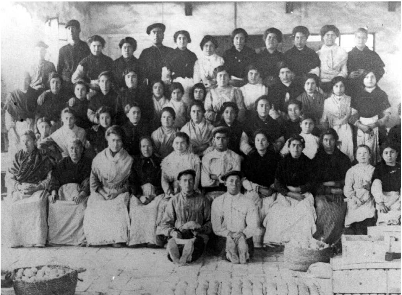
Grup de confeccionadores de taronja.

De tot açò, podem concloure que el treball femení estava mal considerat socialment i s'acudia a aquest majoritàriament per necessitat econòmica, però percebent-lo com una font d'ingressos secundària i temporal fins a millorar les condicions familiars. A més, la dona havia de carregar amb una doble jornada laboral, ja que era responsable de les tasques domèstiques, criar els fills i cuidar el marit, els pares i els sogres. Aquesta consideració tan negativa del seu treball repercutia en un salari molt més baix que el dels homes i unes condicions laborals pèssimes. A això, hem de sumar les particulars característiques del treball a la taronja: era temporal i inestable, i les treballadores podien ser cridades d'un dia per a un altre, o se'ls reclamaven moltes hores extres en ocasions puntuals de la temporada. I a més, els magatzems no estaven ben condicionats per a les treballadores, que havien de passar hores i hores en postures molt incòmodes amb una mala climatització, amb els consegüents problemes físics.