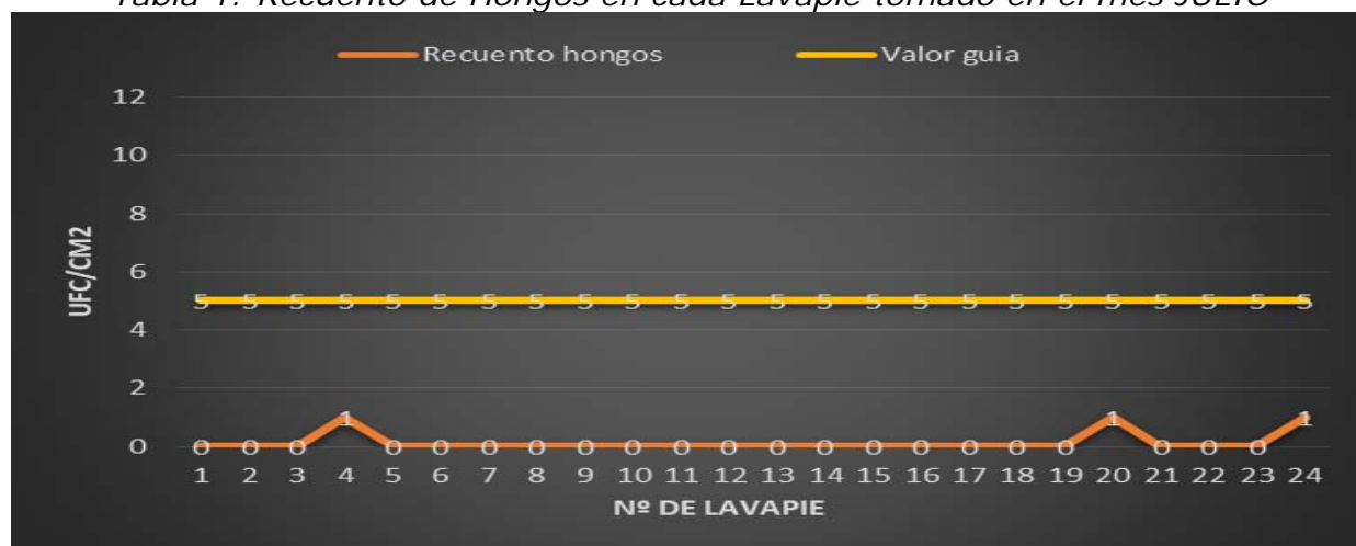
Tabla 1: Recuento de Hongos en cada Lavapie tomado en el mes JULIO

Se establece como valor guía , según el método de análisis citado arriba, el valor de 5 ufc/cm 2 , de manera que a partir de este valor la superficie en concreto presenta riesgo sanitario. No obstante, este valor, podrá ser modificado en posteriores análisis, según la media estadística de los diferentes puntos.