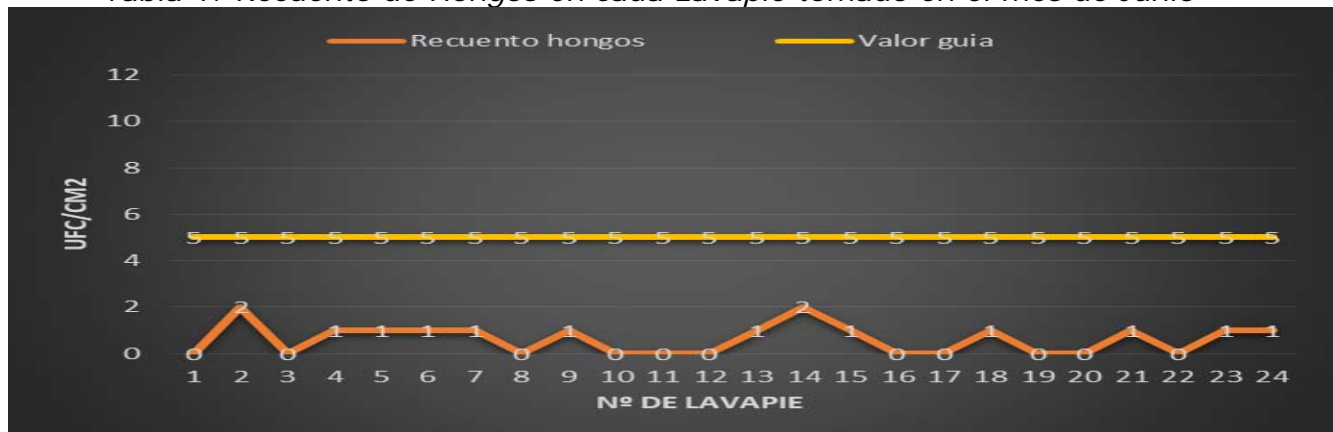
Tabla 1: Recuento de Hongos en cada Lavapie tomado en el mes de Junio

Se establece como valor guía , según el método de análisis citado arriba, el valor de 5 ufc/cm 2 , de manera que a partir de este valor la superficie en concreto presenta riesgo sanitario. No obstante, este valor, podrá ser modificado en posteriores análisis, según la media estadística de los diferentes puntos.