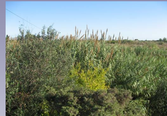
Vista 3. Vegetación de Ribera