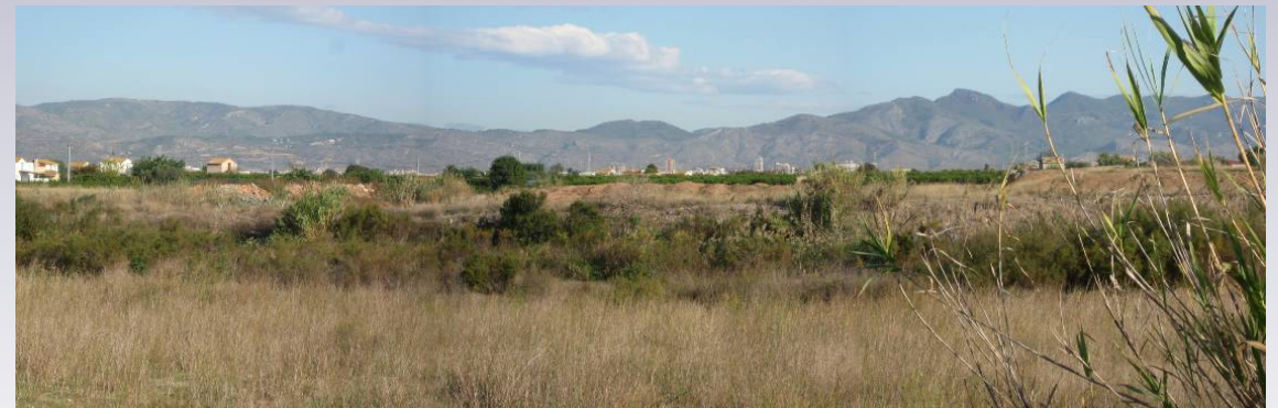
Vista 5. Vista del Cauce desde la Orilla