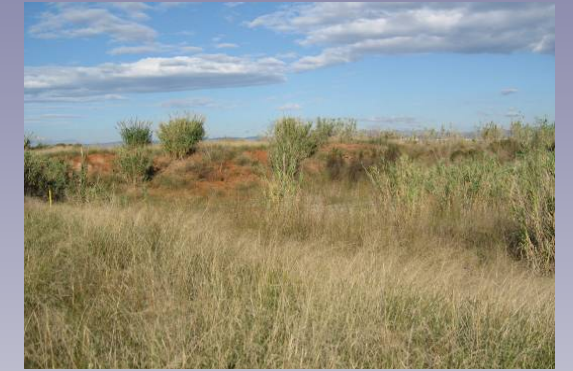
Vista 4. Extracciones de áridos