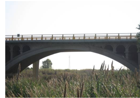
Puente sobre el Río