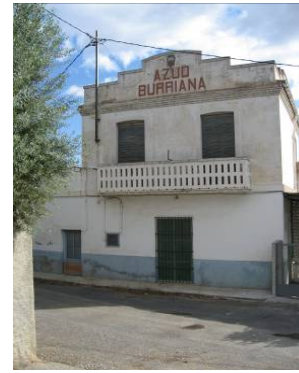
Azud de Burriana