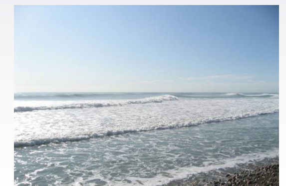
Vista 7. Desembocadura