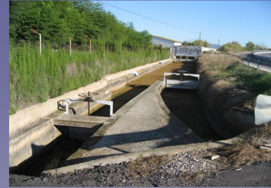
Vista 1. Infraestructuras hidráulicas

La presencia más o menos permanente de agua ha permitido la existencia de una fauna con una elevada diversidad de especies, algunas de ellas de gran interés para la conservación. Abundantes y variadas son las comunidades de aves: anátidas, ardeidas, láridos, limícolas y passeriformes palustres están presentes en los diversos ambientes generados por los gradientes de salinidad provocados por la entrada ocasional de agua marina.