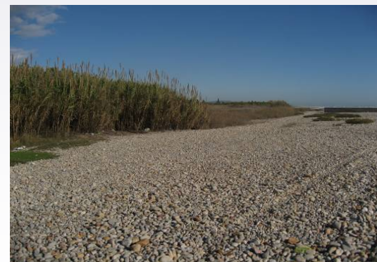
Vista 6. Desembocadura