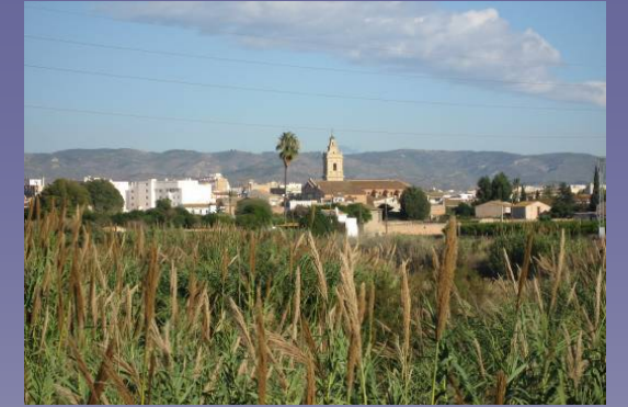
Vista 2. Almazora desde Burriana