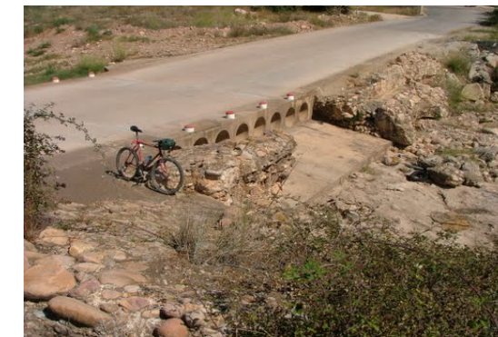
Acueducto romano cercano a la AP- 7