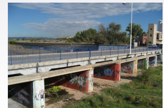
Vista 7. Vegetación