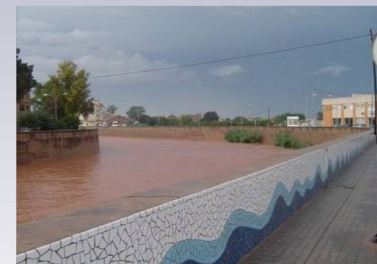
Vista 4. Río lleno