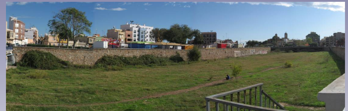
Vista 3. Panorámica Riu Sec