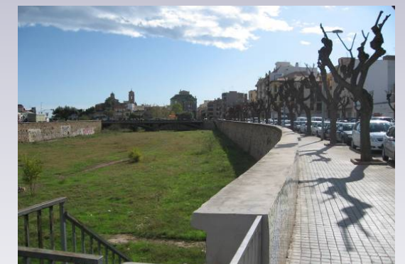
Vista 5. Paseo