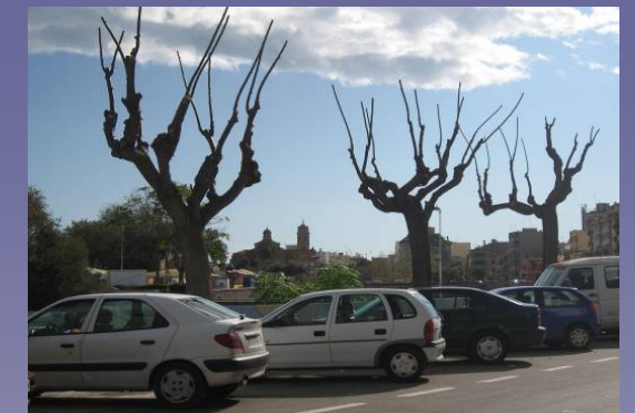
Vista 2. Aparcamientos próximos