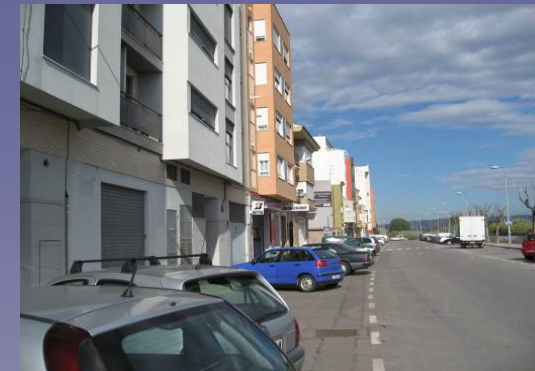
Vista 1. Borde Urbano junto a cauce

El fragmento de paisaje estudiado es la zona que abarca el cauce presente a lo largo del término municipal y la vegetación de ribera asociada a el. La proliferación de la vegetación en el lecho del cauce y la presencia de especies adaptadas a condiciones de sequía permanente indica que el curso de agua es estacional y el cauce permanece seco durante gran parte del año.