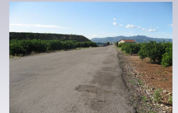
Vista 6. Cantera