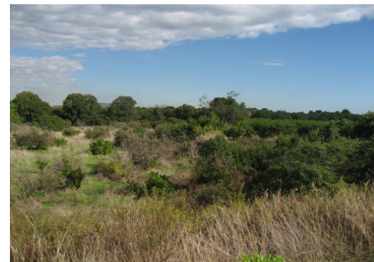
Vegetación asociada a cauce