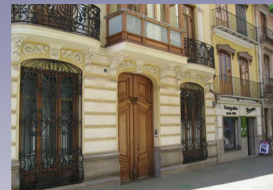
Vista 3. Edificios Modernistas