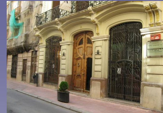
Vista 1. Museo de la Taronga

Existe un colchón entre los dos núcleos urbanos, actualmente ocupado por cultivos de cítricos, cuya tendencia natural es la de integrar también la unidad de paisaje urbano.