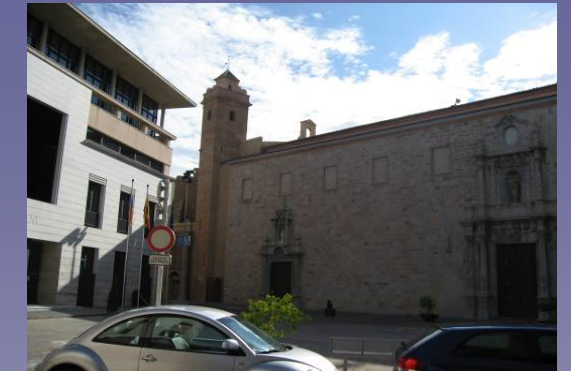
Vista 2. Plaza del Ayuntamiento