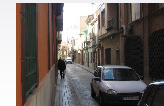
Vista 8. Calles del centro