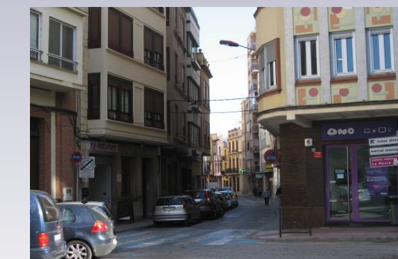
Vista 6. Calles del centro