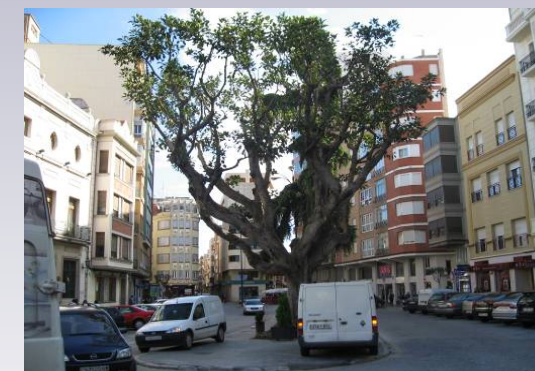
Vista 5. Calles del centro