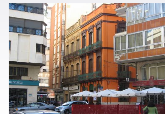
Vista 7. Calles del centro