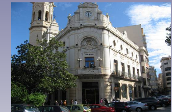
Vista 4. Cooperativa San José