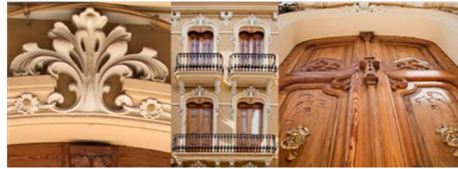
Arquitectura Modernista casco urbano